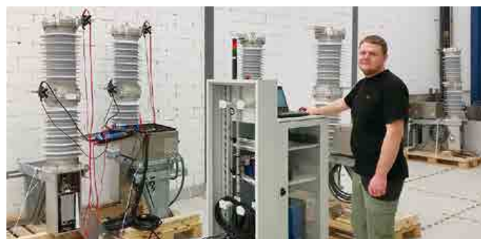
CIBANO 500 Prüfwagen in der ABB-Fertigung für Vakuum-Mittelspannungs-Leistungsschalter.

»Wir haben bereits ein zweites CIBANO 500 Prüfgerät bestellt, das wir parallel und als Backup-System verwenden können, um eine Redundanz zu ermöglichen«, meint er abschließend. ▣