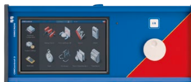
Панель CMControl P

Панель можно подключить к комплекту CMC 310 или использовать как дистанционный пульт управления. Магнитные элементы, расположенные на тыльной стороне, позволяют легко установить панель на стандартный шкаф защиты.