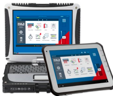
Приложение CMControl P App

Функции CMControl P доступны также в виде приложения, которое устанавливается на ПК под управлением Windows или на планшете Android. Чтобы узнать, как выглядит этот альтернативный вариант управления, на практике, скачайте бесплатное приложение CMControl P App. Версию для ПК под управлением Windows вы найдете в клиентском разделе на сайте OMICRON, а версию для планшетов Android — в магазине GOOGLE Play™.