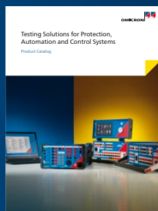
Каталог продукции (вторичное оборудование)

Более подробную информацию, дополнительную литературу и контактные данные региональных офисов по всему миру можно найти на нашем веб-сайте.