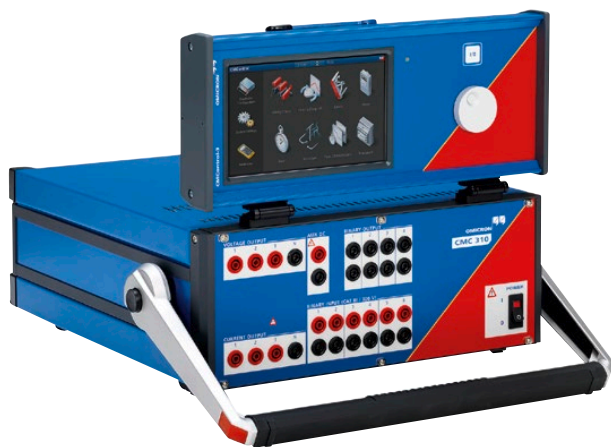
CMC 310 с панелью CMControl P

Три выхода по току: 3 x 32 А / 3 x 430 ВА или 1 x 64 А / 1 x 870 ВА